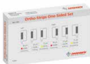
Sortiment Ref. 064

(* siehe auch: Intensiv IPR-DistanceControl, Seiten 72-73)