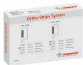
Sortiment Ref. 060B

(* siehe auch: Intensiv IPR-DistanceControl, Seiten 72-73)